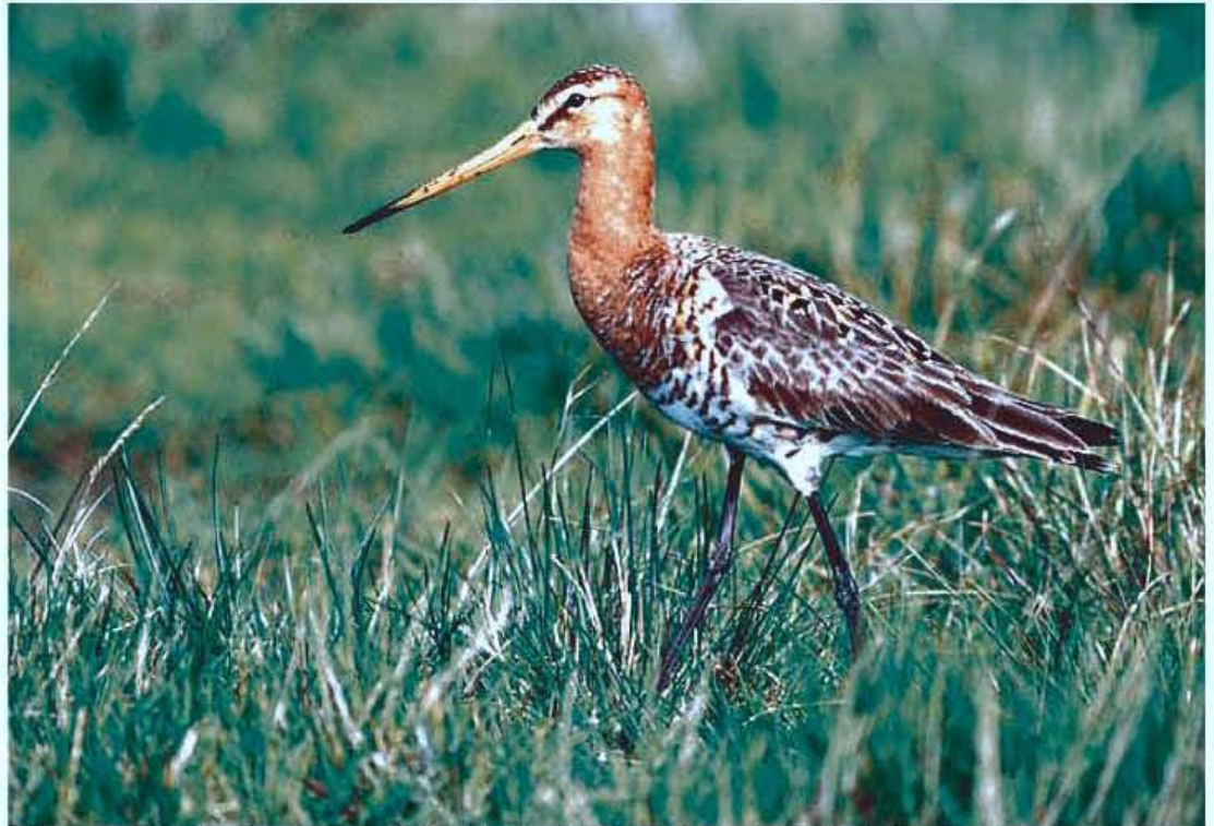
Auf Wiesen und Weiden angewiesen: Der Bestand der Uferschnepfe ist in Schleswig-Holstein drastisch zurückgegangen.